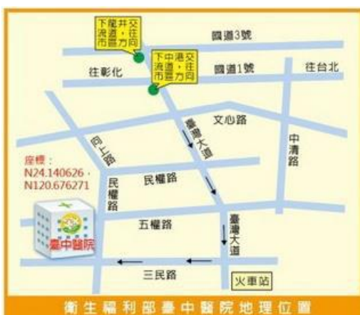
衛生福利部臺中醫院 門診體檢中心位置圖