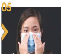
05 把外科口罩的金屬條沿鼻樑兩側按緊。