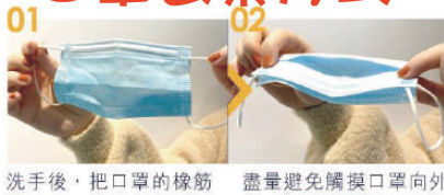
01 洗手後，把口罩的橡筋從雙耳除下。