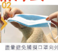
02 盡量避免觸摸口罩向外側部份，將口罩往外摺。