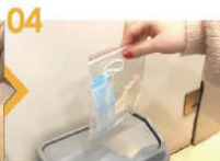
04 將卸除的口罩棄置於有蓋垃圾桶內，然後立即清潔雙手。