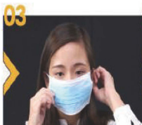
03 如選用掛耳式外科口，把橡筋繞在耳朵上，使口罩緊貼面部。