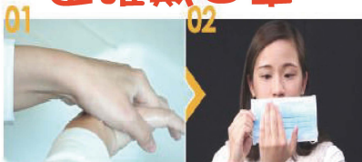
01 佩戴外科口罩前，應先洗手。