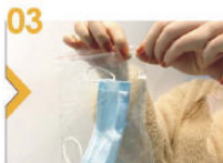
03 放進密實袋內封好。