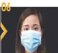
06 佩戴口罩後，應避免觸摸口罩。若必須觸摸口罩，在觸摸前、後都要徹底洗手。