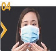
04 拉開外科口罩，使口罩完全覆蓋口、鼻和下巴。